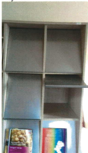
zdjęcie nr 1 – przykładowy regał z pozycji „9”